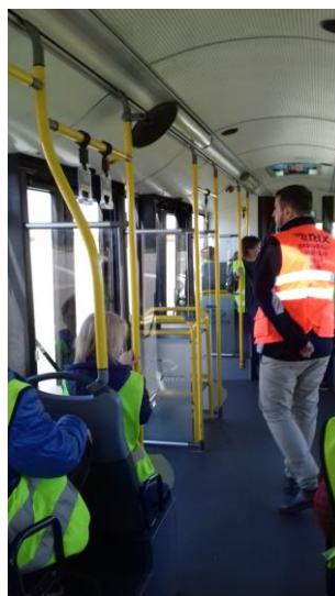
Ekskursijas vadītājs un skolēni ekskursijas laikā